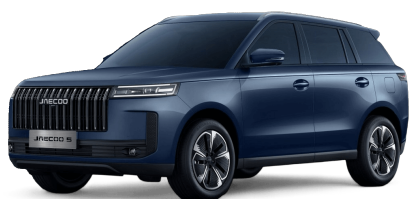
Glacier Blue 0 €