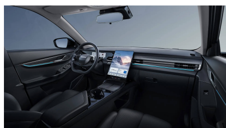
Čierny interiér 0 €