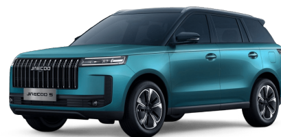
Alpine Green / Čierny top 700 €