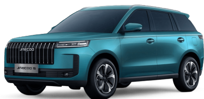
Alpine Green 400 €