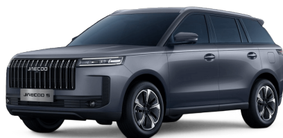
Zircon Gray 400 €