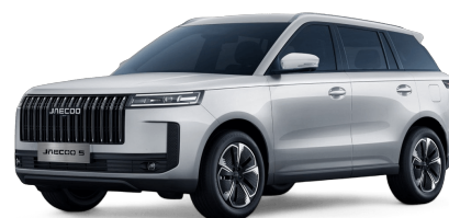
Snowy White 400 €