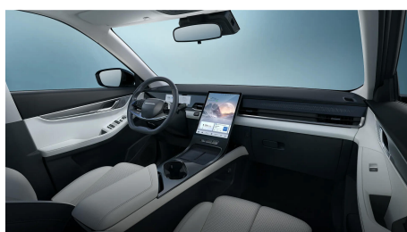
Sivo-čierny interiér 500 €