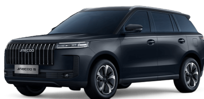
Canyon Black 400 €