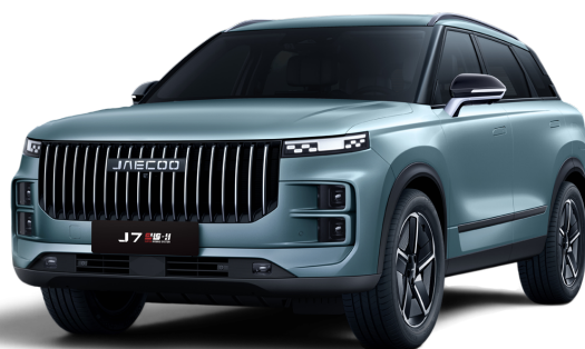
Sivá 500 €