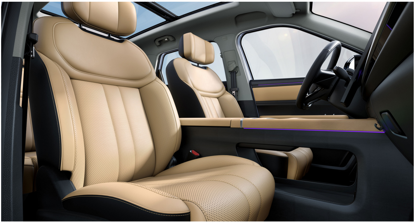
Hnedý interiér 500 €