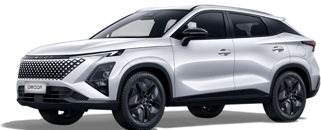
Khaki biela 400 €