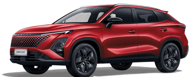
Krvavo červená 0 €