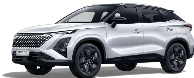
Khaki biela a Čierny top 700 €