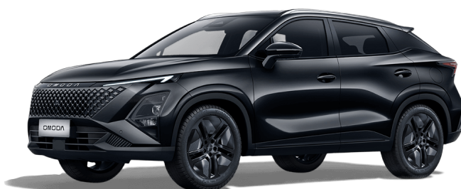
Uhlíkově čierna 400 €