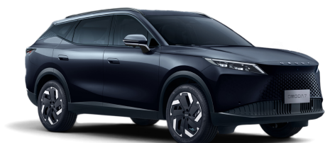
Carbon Black 800 €