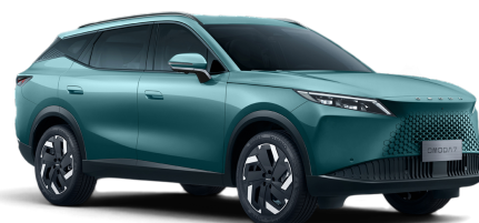
Misty Green 800 €