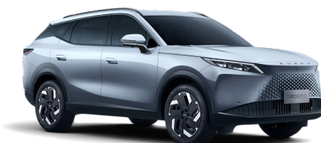
Moonlight Silver 800 €